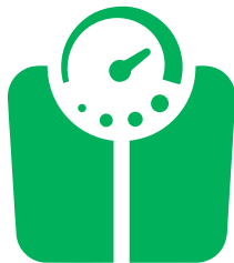
Gå ner i vikt, om du behöver det